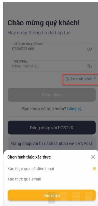
Hình 1: Màn hình “ Chọn quên mật khẩu ”

Bước 1: Tại màn hình “Đăng nhập”. Người sử dụng chọn “Quên mật khẩu”. Hệ thống yêu cầu chọn hình thức xác thực. Mặc định Xác thực bằng SĐT.