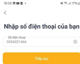
Hình 2: Màn hình “ Nhập số điện thoại ”

Bước 2: Tại màn hình nhập SĐT, Người sử dụng nhập SĐT đã đăng ký tài khoản. Nhấn “Tiếp tục”