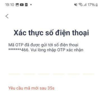
Hình 4: Màn hình “ Nhập OTP ”

Bước 4: Hệ thống hiển thị màn hình nhập OTP, Người sử dụng nhập mã OPT đã được gửi qua tin nhắn về SĐT đăng ký tài khoản.