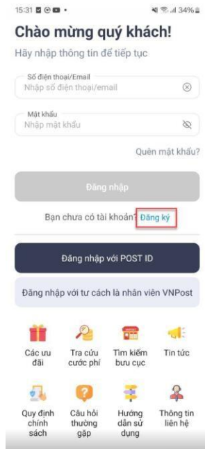
Hình 1: Màn hình “Trang chủ chưa đăng nhập”

Bước 1: Trên trang chủ chưa đăng nhập chọn “Đăng ký”.