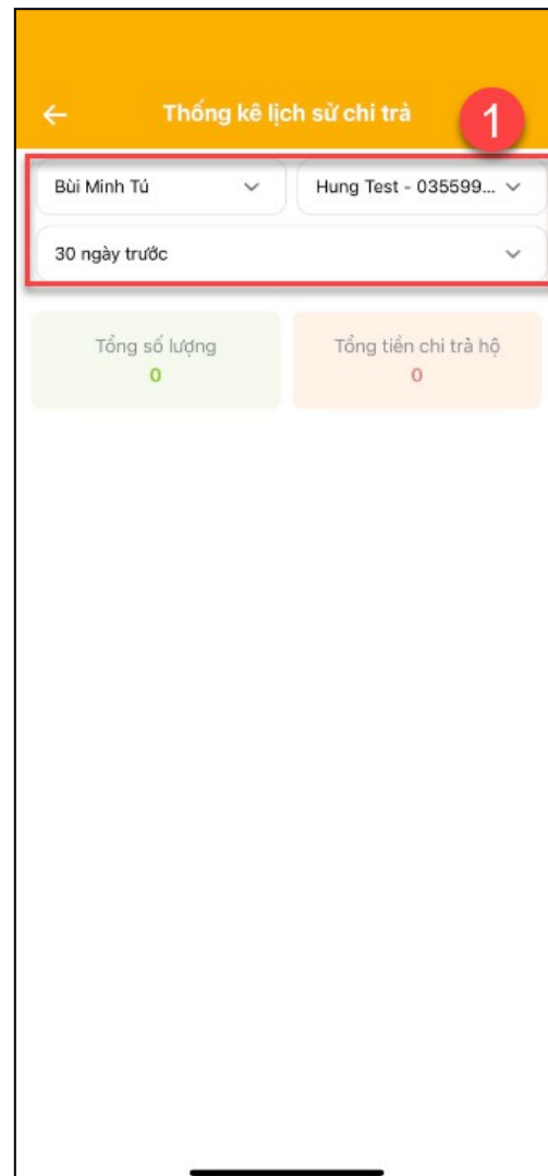
Hình 4 : Màn hình Thống kê lịch sử chi trả khi tìm kiếm nhanh

Sau khi chọn tham số, hệ thống tính toán và hiển thị dữ liệu thống kê Tổng số lượng, Tổng tiền chi trả hộ tương ứng.