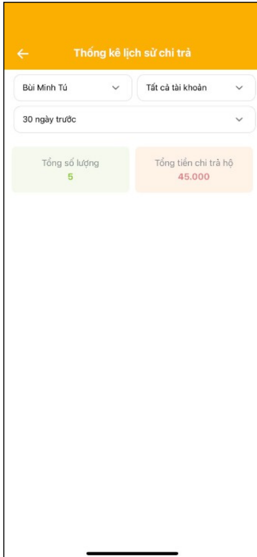
Hình 3 : Màn hình Thống kê lịch sử chi trả

Bước 3: Màn hình Thống kê lịch sử chi trả.